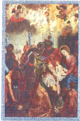
«EL NIÑO» Adoración de los Reyes Magos Hendrick Van Balen Museo Nacional del Prado