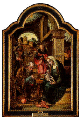
«EL NIÑO» La Adoración de los Magos Pieter Coecke Van Aelst Museo Nacional del Prado